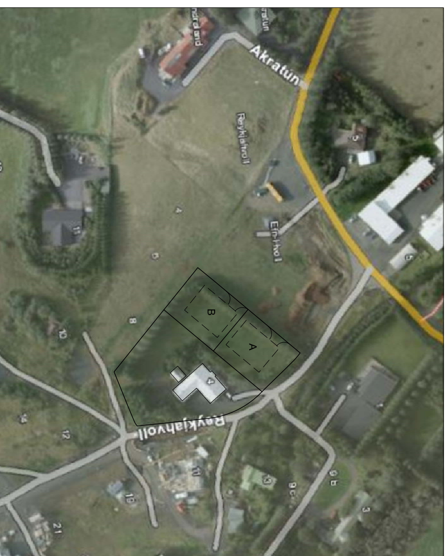
SKÝRINGARMYND AF BREYTINGARTILLOGU - LOFTMYND M 1:2000

Að öðru leyti gilda sömu skilmálar fyrir svæðið.