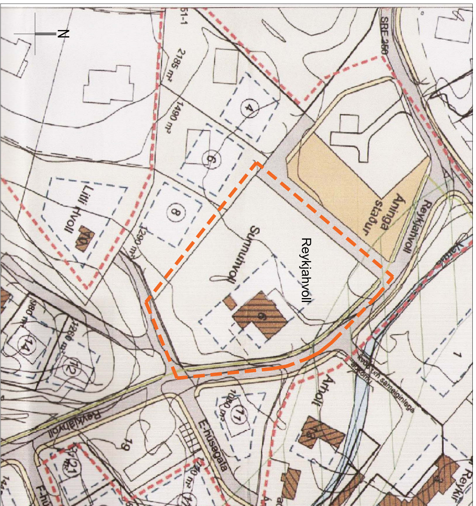
GILDANDI DELISKIPULAG M 1:1000

Í gildi er deiliskipulag frá Reykjalundarvegi að Húsadal sem samþykkt var í bæjarstjórn Mosfellsbæjar þ. 21. janúar 2004.