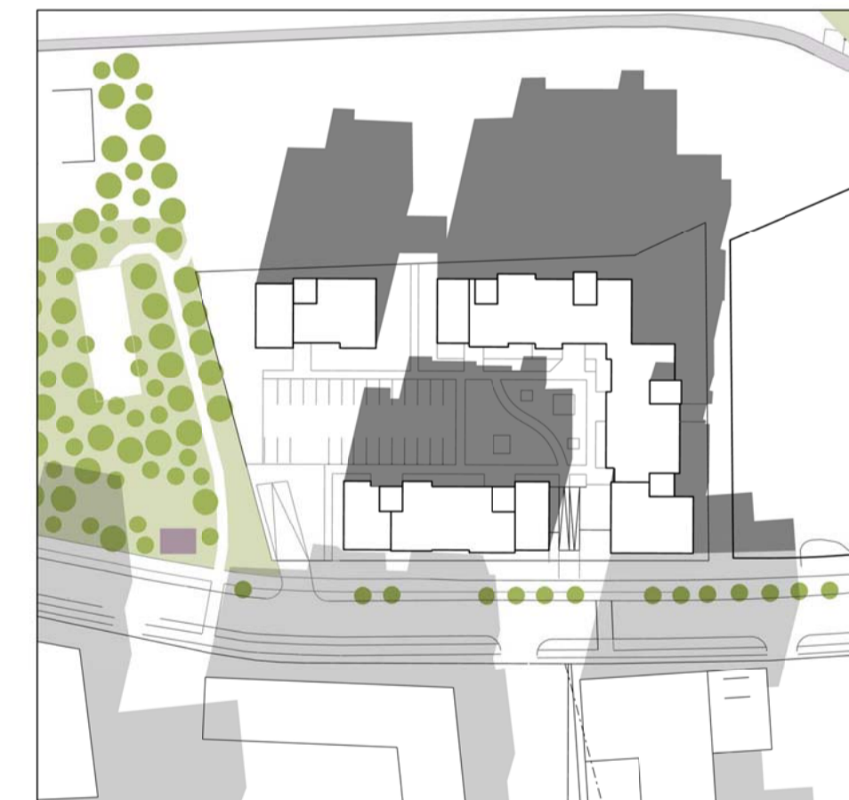
Mars kl. 13.00