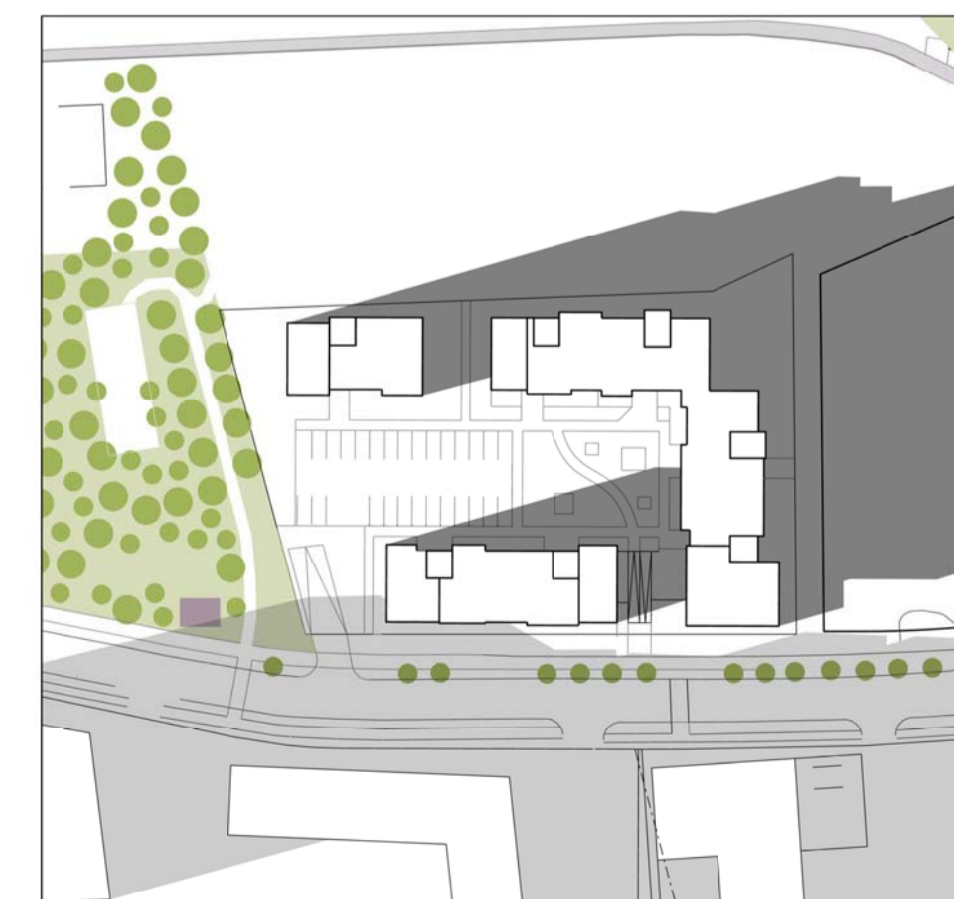
Mars kl. 17.00