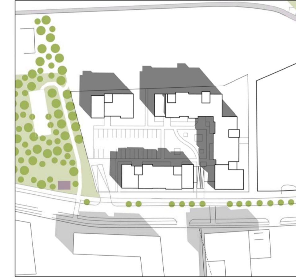
Júní kl. 10.00