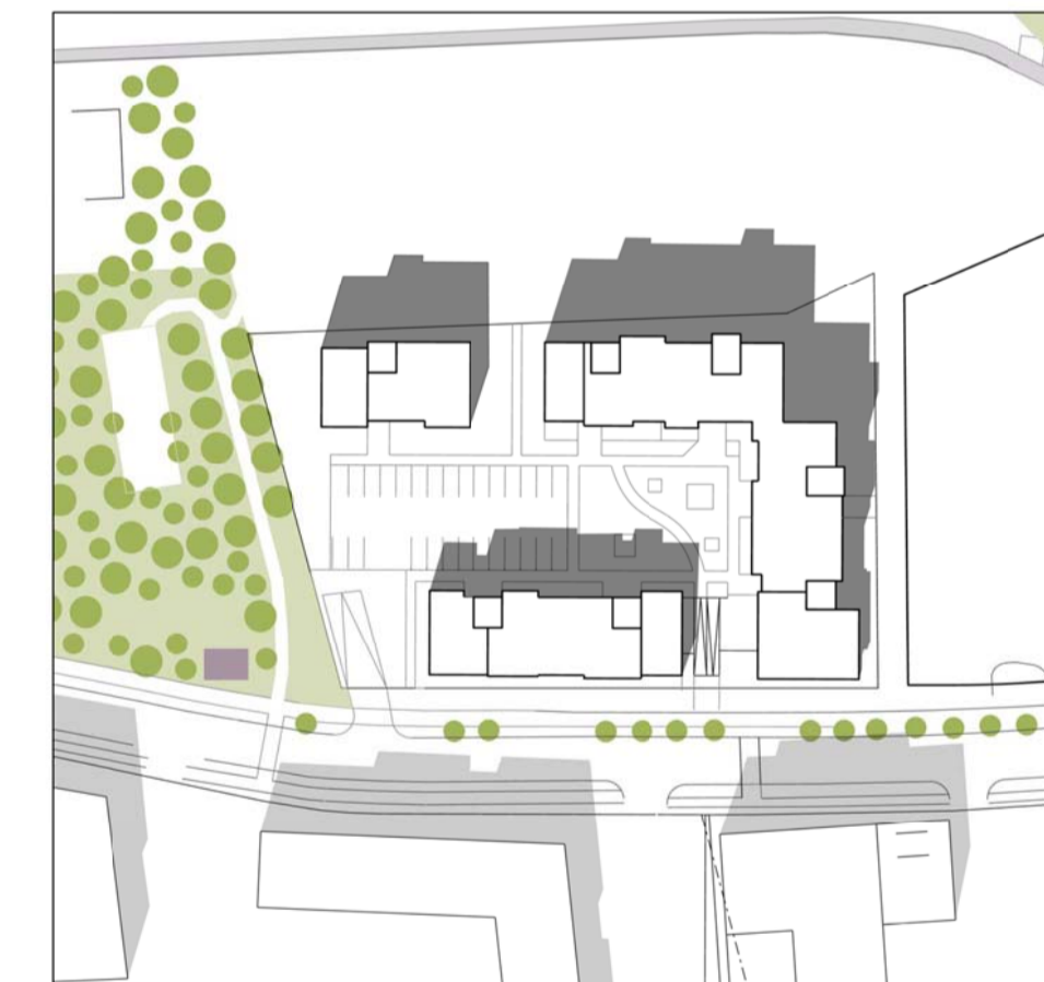
Júní kl. 13.00