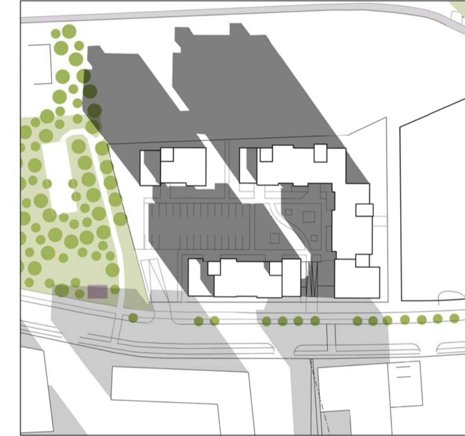
Mars kl. 10.00