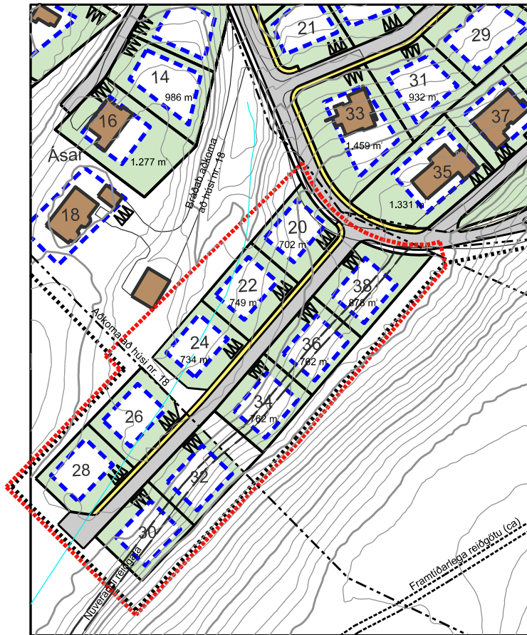
BREYTT DEILISKIPULAG M. 1 : 1.000