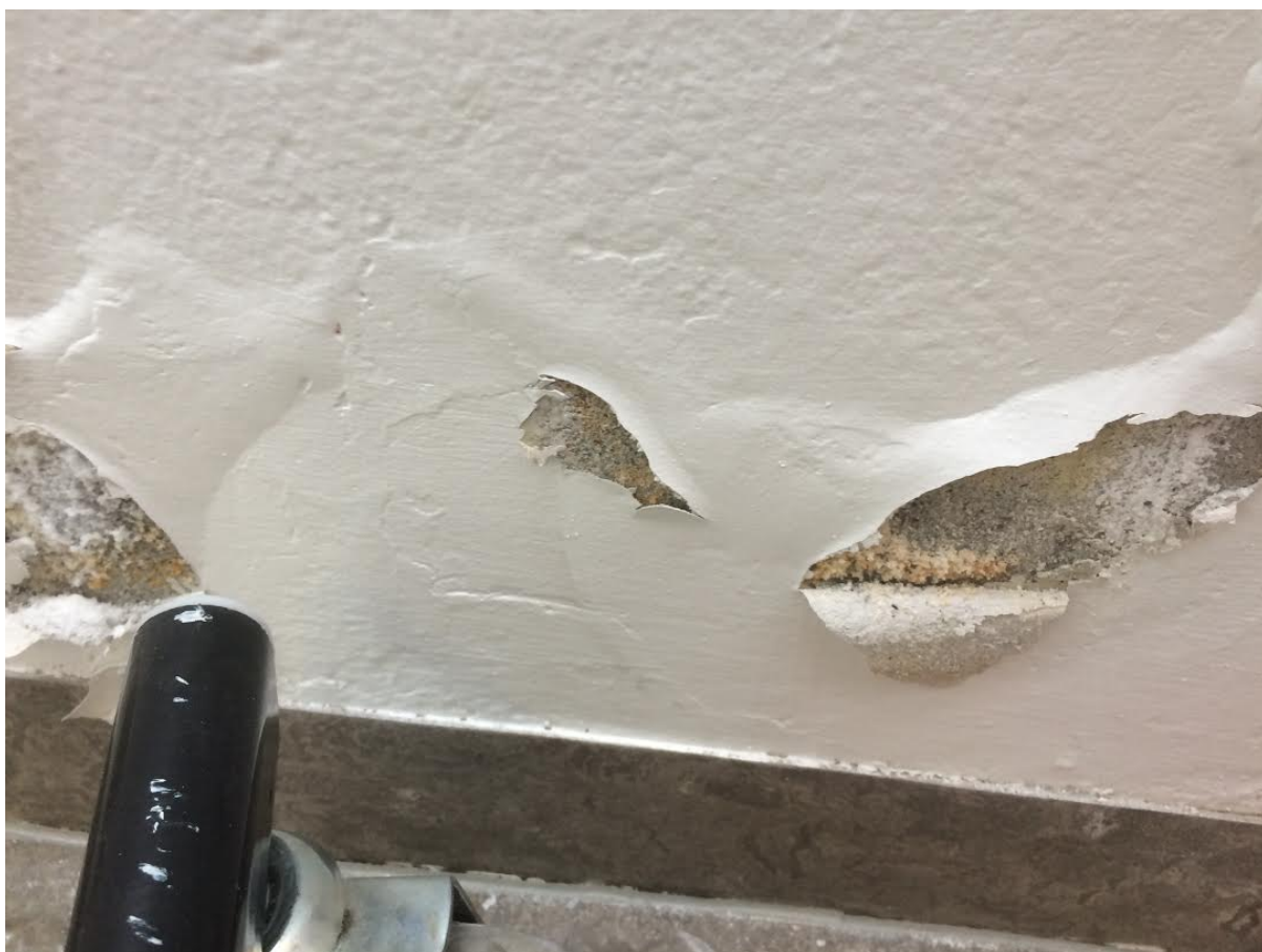
Mynd 3. Búið að opna áður nefnt gólf í við anddyri eldri deildar Varmárskóla.