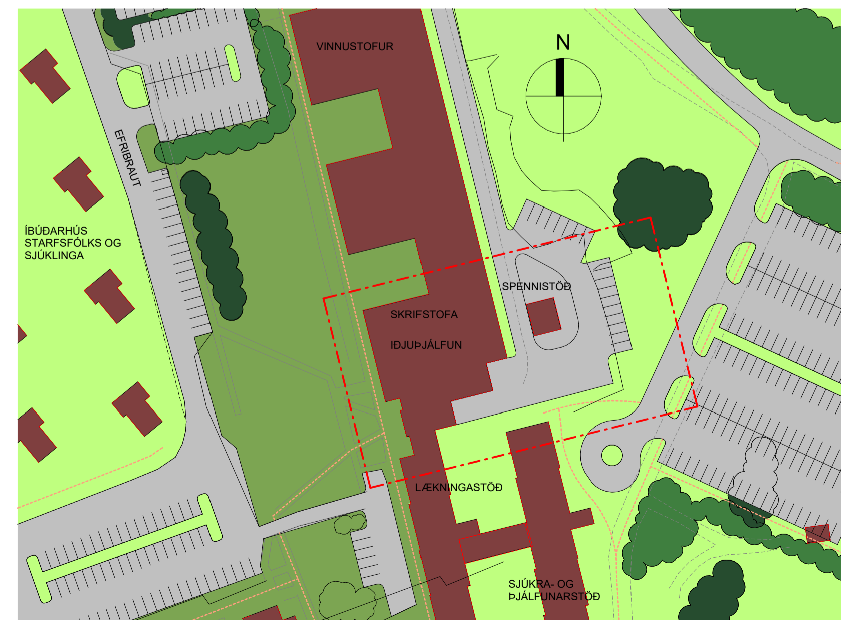
Hluti úr gildandi deiliskipulagi Reykjalundar