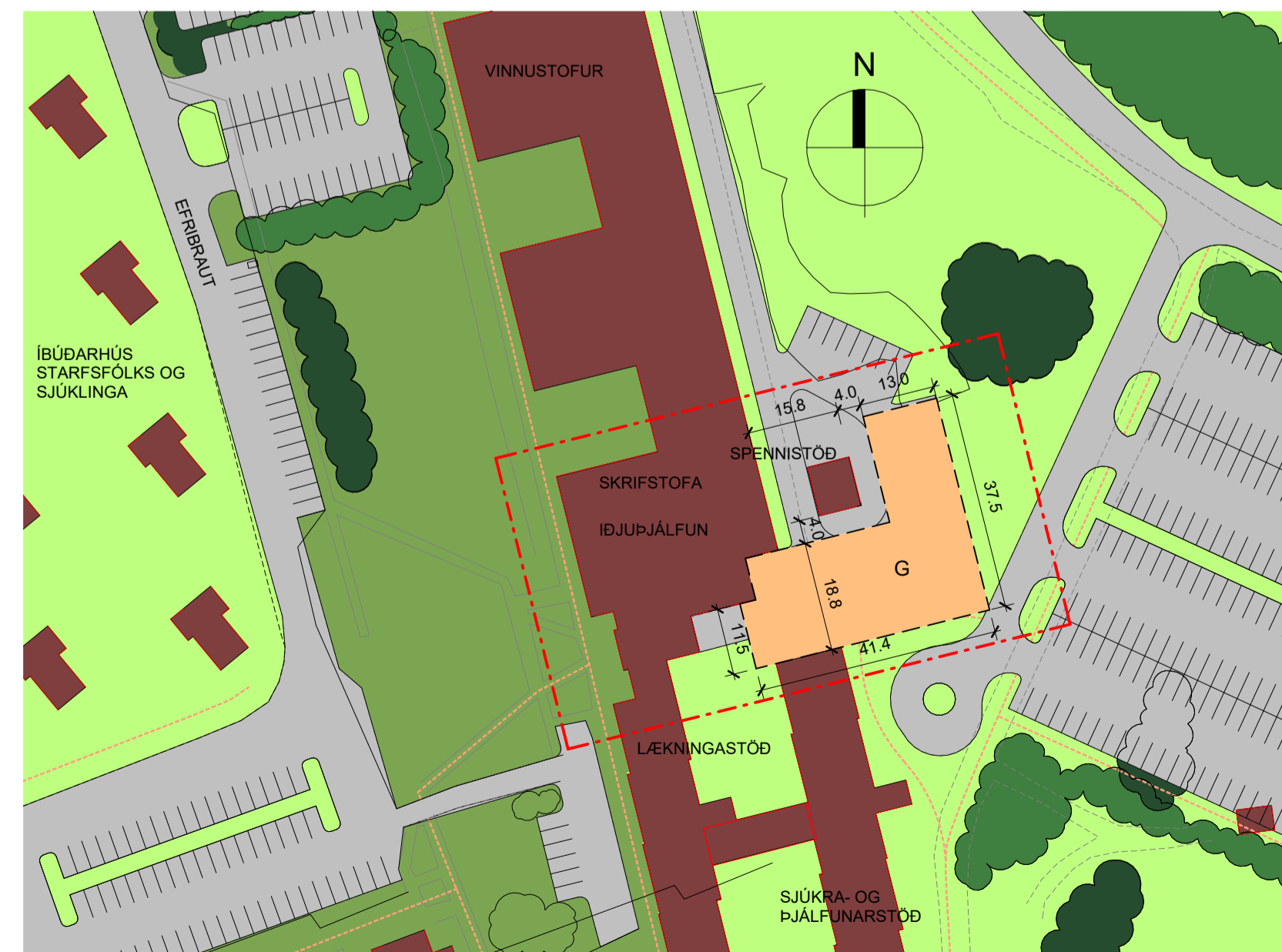
Breyting á deiliskipulagi Reykjalundar