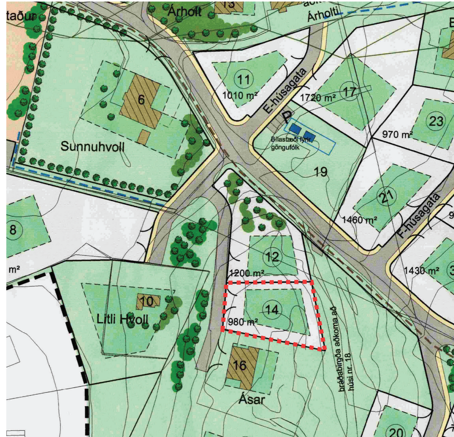
Merkt lóð Reykjavolls 14 sem að tillaga að breyttu deiliskipulagi nær til. MKV 1:1000

Skilmálar samþ. 21. janúar 2004. Úrdráttur úr töflu á bls. 18.