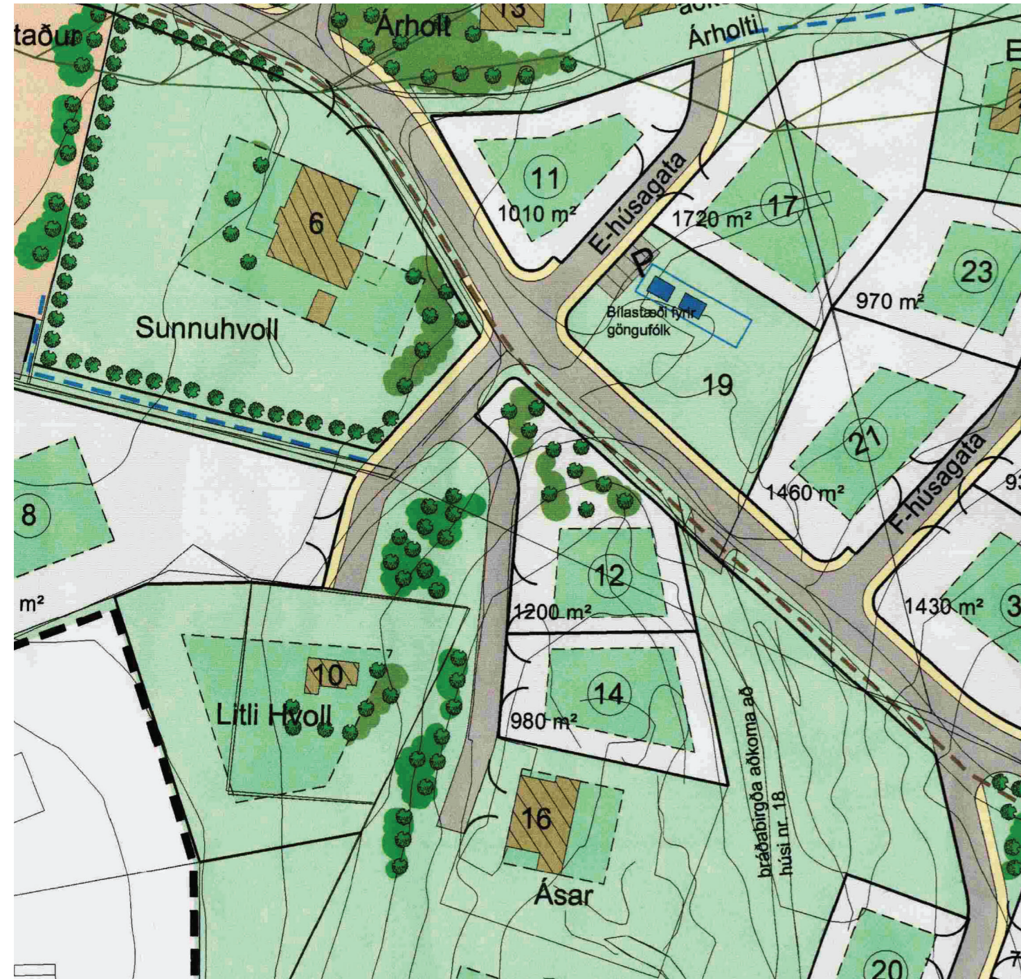
Hluti deiliskipulagsuppráttar, samþ. 21. janúar 2004 MKV 1:1000

Gildandi skilmálar fyrir lóðina í töflu yfir stærðir nýbygginga og viðbygginga á bls. 18 í skilmálum - Efri Reykjabyggð. (Lóðin Reykjavoll 14 er nefnd "Við Ása nr. 14 í töflu).