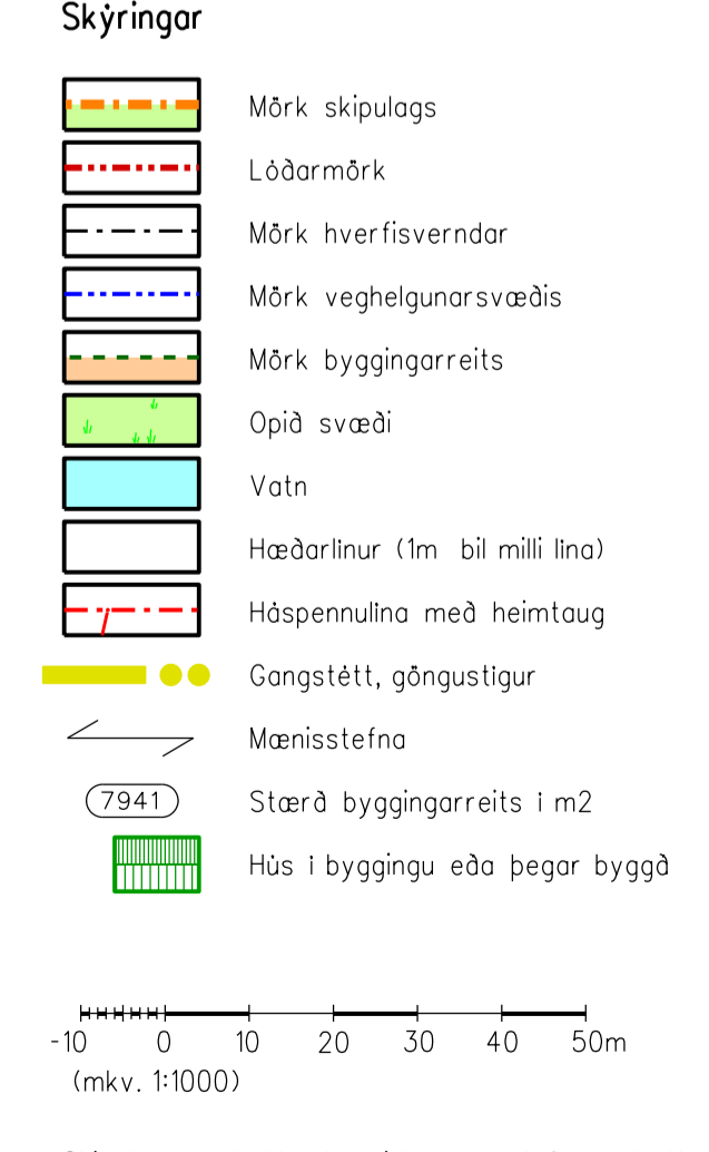
Skipulagsuppráttur þessi kemur í stað uppráttar sem samþykkt var 24. mars 2010, og fellur sá uppráttur þar með úr gildi.

Reitir C-D: Á reitnum skal reisa smáhýsi til íbúðar fyrir starfsfólk og útleigu í ferðabjónustu. Hvert hús má vera 70-100m 2 að flatarmáli. Húsin verða einlytt en heimilt er að hafa í þeim svefnloft. Gert er ráð fyrir einni íbúð í hverju húsi. Mesta hæð hvers húss má vera 6,5m og samantlagt flatarmál íbúðarhúsa má vera 2.500m 2 að hámarki, svefnloft ekki meðtalin. Reitir E: Á reitnum skal reisa gróðurhús úr stáldál og gleri, samantlagt hámarksflatarmál 2.500m 2 og hámarks hæð 7,5m. Einnig er heimilt að reisa þar 2 íbúðarhús ásamt tilgæmslum, samantlagt hámarksflatarmál 1.300m 2 og mesta hæð 6,5m. Hámarksnýting alls svæðisins má vera 0,3. Skipulagsbreyting, samantekt: Reitir B: Byggingarreit breytt lítilsháttar. Reitir C-D: Reiturinn ætlaður einngöngu fyrir smáhýsi en atvæðis- og þjónustueining flyst yfir á reit B. Reitir E: Reiturinn ætlaður fyrir gróðurhús og 2 íbúðarhús ásamt tilgæmslum.